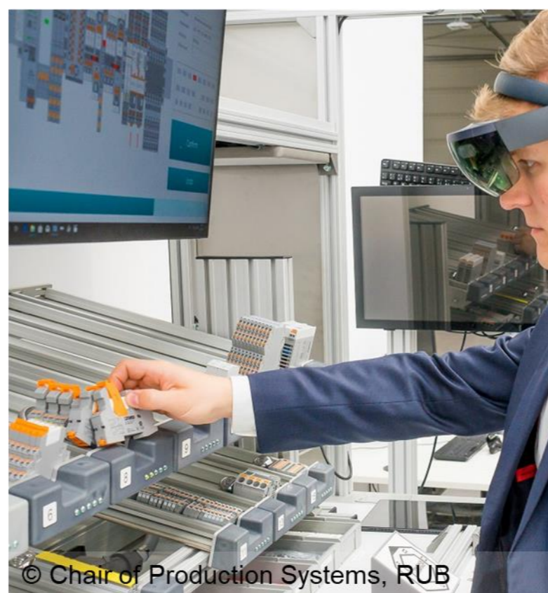
© Chair of Production Systems, RUB